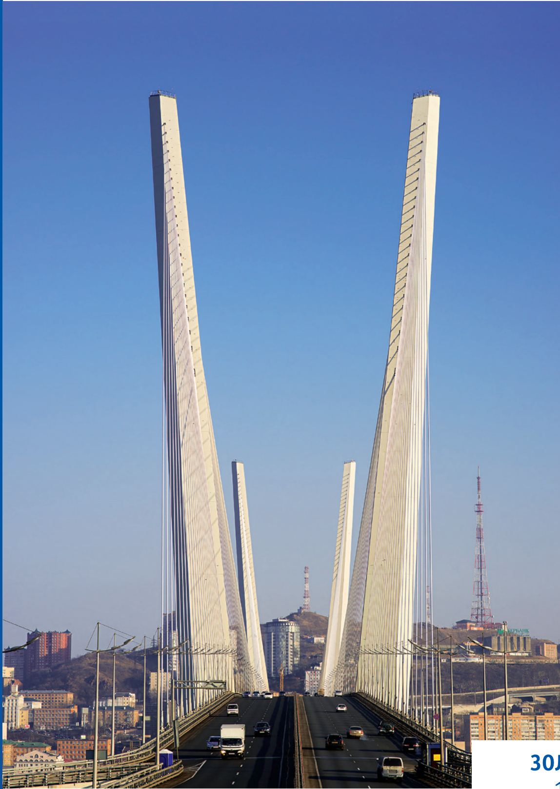
ЗОЛОТОЙ МОСТ 11.08.2012